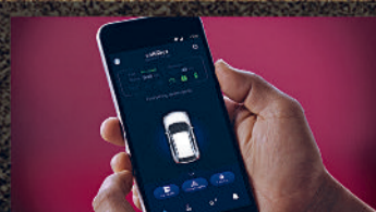
IN-BUILT SUZUKI CONNECT

3 years 100 000 km WARRANTY* EXTENDABLE UPTO 6 YEARS