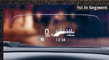
HEAD UP DISPLAY