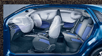
6 AIRBAGS ^