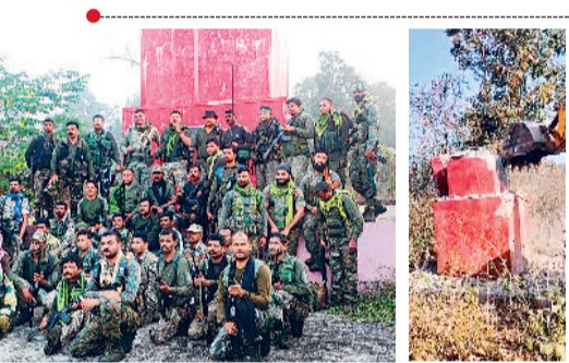
वर्ष में छह बार दिखाते हैं ताकत

नक्सल संगठन द्वारा वर्ष में छह बार विभिन्न आयोजनों के दौरान स्मारक तैयार किया जाता है और इलाके के लोगों को अपनी ताकत दिखाते हैं। नक्सल कैलेंडर के मुताबिक 22 अप्रैल को नक्सली लेनिन जन्मदिवस मनाते हैं। इसके बाद 5 से 11 जून तक ▶▶शेष पेज 2 पर