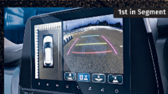
360 VIEW CAMERA