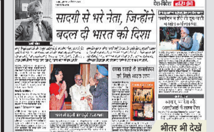
सादगी से भरने नेता, जिन्होंने बदल दी भारत की दिशा

नक्सली संगठन में शामिल बड़े कैडर के लिए बड़ा व छोटे कैडर के नक्सलियों की याद में छोटे स्मारक तैयार किया जाता है। चार दिन पूर्व भी नक्सलियों द्वारा बनाए गए सबसे बड़े स्मारक को ब्लास्ट कर जमींदोज किया गया। जानकारी के मुताबिक लगभग दो वर्ष पूर्व नक्सलियों ने 3 अगस्त 2021 को यहां 90 फीट उचाई स्मारक व स्थायी मंच का निर्माण कराया था। यह ▶▶शेष पेज 2 पर