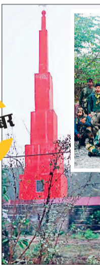
वर्ष में छह बार दिखाते हैं ताकत

नक्सलियों द्वारा विशेष अवसरों पर अपने साथियों की याद में अपने आधार क्षेत्र के गांवों व जंगलों में स्मारक बनाया जाता रहा है। अब फोर्स उनके आधार इलाकों में घुसकर एक ओर मुठभेड़ में नक्सलियों को मार रहे हैं, वहीं दूसरी ओर उनकी यादों को भी समाप्त कर रहे हैं। आकड़ों की बात करें तो बीते कुछ वर्षों में 300 से अधिक छोटे ▶▶शेष पेज 2 पर